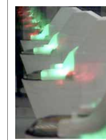
De nieuwe zelfscanpoortjes.