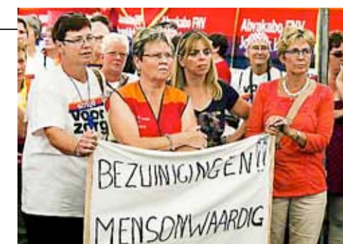
Thuiszorgmedewerkers in actie

Bij openbare aanbestedingen in de Europese Unie hoeven overheidsinstanties voortaan niet meer automatisch het laagste bod te kiezen. Dat heeft het Europees Parlement in Straatsburg woensdag besloten. De nieuwe regels bieden meer mogelijkheden om sociaal en duurzaam aan te besteden. Een goede zaak. Zo hoeven thuiszorgmedewerkers niet telkens tegen slechtere arbeidsvoorwaarden bij een nieuwe organisatie te solliciteren, omdat de gemeente bij de aanbesteding voor een nog goedkopere aanbieder heeft gekozen.