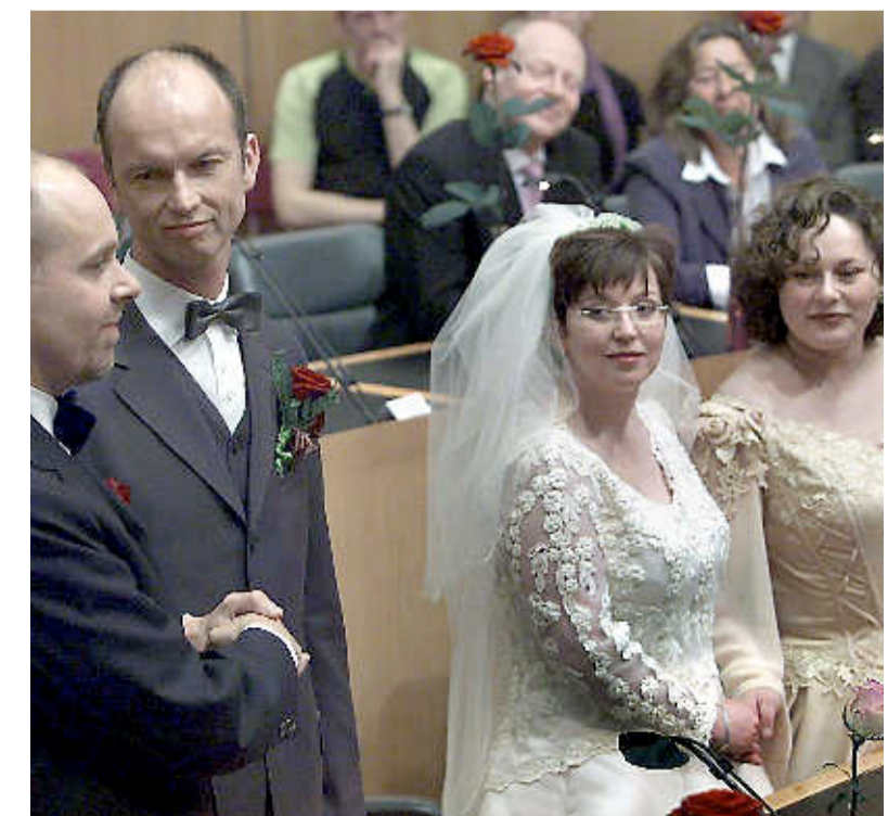
De eerste homohuwelijken in 2001: toppunt van integratie.

De grensbewakers op Schiphol hebben het niet makkelijk. Ze moeten de fraudeurs eruit pikken, terwijl de gewone reiziger zo snel mogelijk door wil - vliegzeuren brengen al genoeg wachttijden met zich mee. Het probleem laat zich deels verhelpen met de opkomst van de selfservice-paspoortcontrole. Die zijn sinds 27 maart 2012 in bedrijf en is te gebruiken voor EU-paspoorten met een chip. Vorig jaar waren er al twee miljoen gebruikers. De poorten werken met gezichtsherkenning, die de digitale pasfoto in het paspoort vergelijkt met het gezicht van de reiziger. Je legt je paspoort eronder, kijkt in de lens en als de beide foto's overeen komen, zwaaien de deurtjes open. Als je tenminste niet gezocht wordt of onbetaalde boetes hebt openstaan. Nog altijd houdt een marechaussee-functionaris toezicht op de scanners. Opperwachter Erwin Rasterhoff bijvoorbeeld. „Het is een samenwerking tussen mens en machine. Wij kunnen de scanner nog altijd overrulen.”